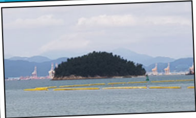
전남 여수시 ‘서치도(鼠峙島)’